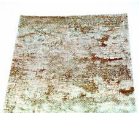
Tarnnetz Winter, grau- weiß mit braun