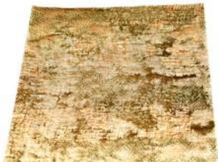
Tarnnetz Wüste, gelb- braun

Sie können die Tarnnetze aber auch falten und zu Paketen rollen, um die Netze dann auf Fahrzeugen zu befestigen. Als „Befestigungsriemen“ kann man sehr dünnen Gummi „Bailauffaden“ benutzen, damit entstehen die Einbuchtungen der Tarnnetz- Rollen.